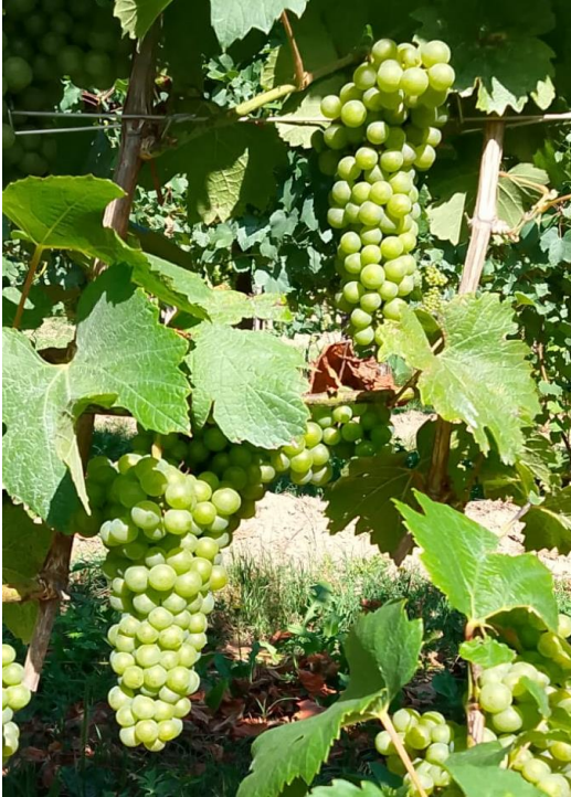
Invaiaitura su Chardonnay

Fare sempre attenzione a tutto ciò che viene riportato sull' etichetta degli agrofarmaci da utilizzare, anche nella loro compatibilità con le altre sostanze, rispettando i divieti sull'uso di determinati prodotti riportati nei Regolamenti comunali di polizia rurale , o vietati dalle Cantine sociali e/o private di appartenenza , o sconsigliati/limitati nella certificazione SQNPI e nei Protocolli/Vademecum viticoli .