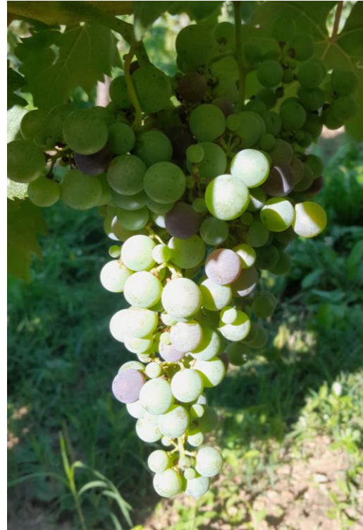
Inizio invaiatura su Cabernet franc