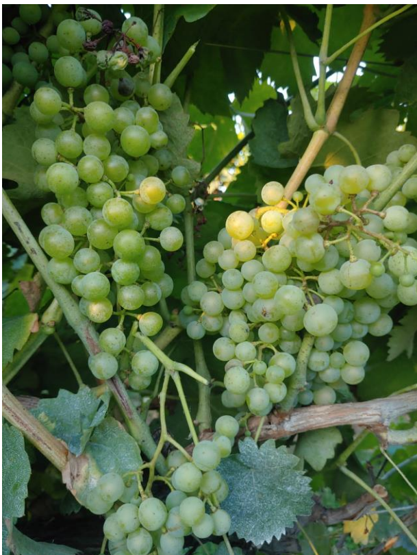
Inizio invaiatura su Glera (Gasparinetti/Bernardi)